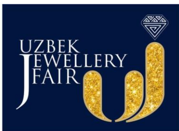
График и Тематическое содержание выставки