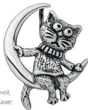
Подвес «Лунатик», артикул 1789; серебро 925°

А уж сколько выпускается сувенирной продукции с изображениями котов и кошек! Пожалуй, ни один турист не уезжает из города на Неве без магнитика с митьковской Тишиной Матроскиной, да и петербурженки нередко украшают свой наряд знаменитыми шарфиками с котами.