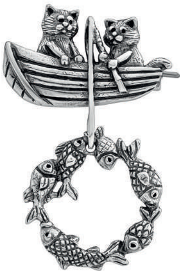
Брошь-кулон «Большая рыбалка», артикул 1883; серебро 925°

А как же милые и нежные домашние котики? Ювелирам не чуждо ничто человеческое, и страсть к домашним питомцам не обходит их стороной.