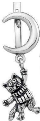
Серьги «Лунатик», артикул 1789; серебро 925°