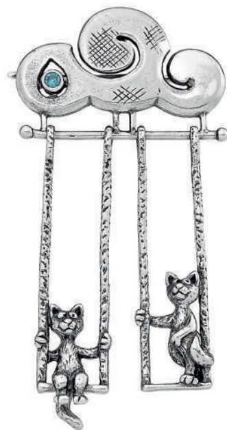
Брошь-кулон «Процужка в облаках», артикул 1562; серебро 925°

дования кошек», в котором писал, что «любая домашняя кошка — это шедевр, созданный природой». Кошки навсегда вернулись на ювелирную арену, теперь они говорили об изяществе и грации, непредсказуемости и магической привлекательности обладательниц таких ювелирных украшений.