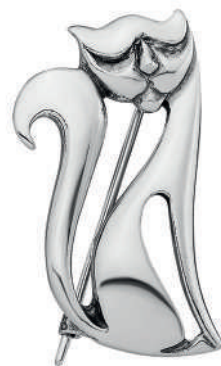
Брошь «Лудвин», артикул 1800; серебро 925°

Карл Лагерфельд рядом с картиной своей кошки Шупетт, 2015