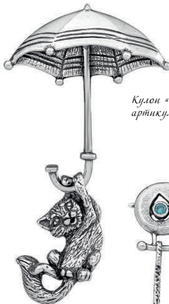
Кулон «Марашютист», артикул 1818; серебро 925°

В Средневековье репутацию кошек подпортили подозрения в лени, похоти и причастности к черной магии. Но уже в эпоху Возрождения животным вновь вернули статус домашних любимцев и хранителей уюта. Леонардо да Винчи посвятил им целый альбом «Исле-