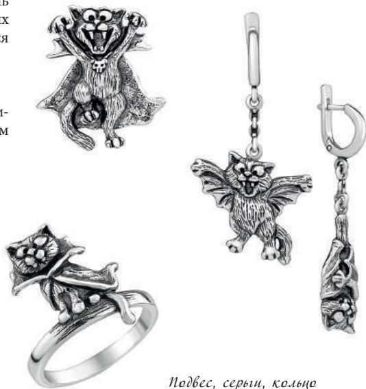
Подвес, серьги, кольцо «Маски сброшены», артикул 1870; серебро 925°

Аниме-малышка белая кошечка Hello Kitty уже более 40 лет украшает аксессуары для девочек по всему миру. Для многих тысяч юных модниц этот милый персонаж,