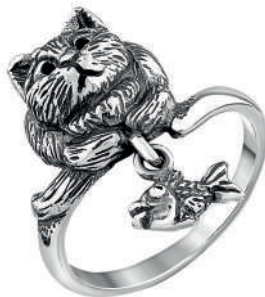
Кольцо «Озеро надежды», артикул 1885; серебро 925°